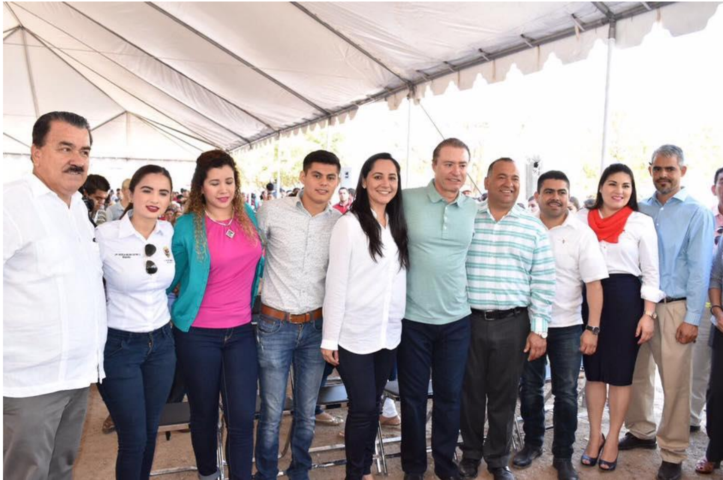
Banderazo de Inicio diversos pavimentos en la Ciudad de La Cruz