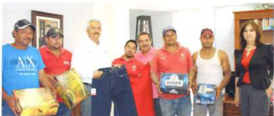
Apoyo a Trabajadores de Elota.