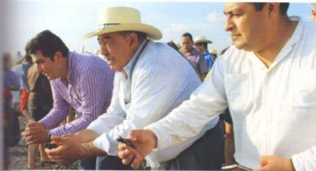
Observación de Tortugas en la Playa de Ceutá.

Asistimos a una reunión nacional con el <<Grupo Tortuguero de las Californias A.C.>>. En el encuentro, presentamos y analizamos los resultados de anidación de la tortuga marina para la temporada 2014-2015, además de participar en la muestra de un audiovisual sobre educación ambiental y preservación de la flora y fauna de los campamentos tortugueros del país.