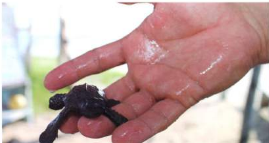
Santuario de la Tortuga Marina de Playa Ceuta.

Entregamos el <<Proyecto Ejecutivo del Santuario de la Tortuga Marina de Playa Ceuta>> a la SECTUR (Secretaría de Turismo) Sinaloa y a la Unidad de Inversión del Gobierno del Estado. El proyecto consiste en la construcción de la segunda etapa del campamento tortuguero, con una inversión total de 7 millones de pesos.