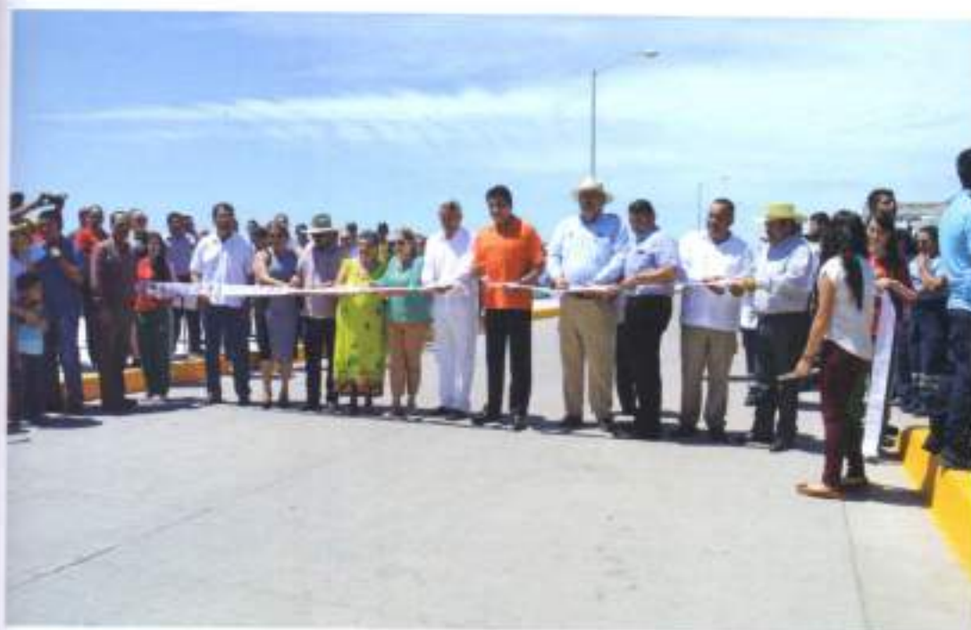
Reinauguración del Malecón de la Playa de Ceuta.

De igual manera, este año arrancamos la construcción del Centro de Desarrollo Comunitario en la Unidad Deportiva <<Julio Lerma Quintero>> y la construcción de la Casa del Museo Municipal, obras que sin duda vienen a impactar positivamente en el desarrollo de Elota y la calidad de vida de sus ciudadanos.