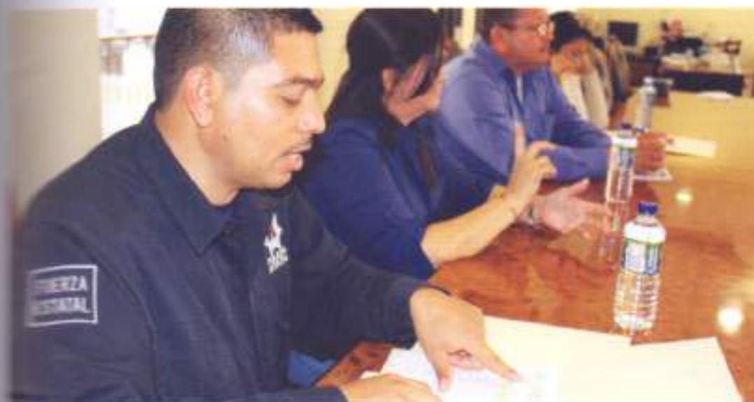
Revisión de Informe Policial.

En base a los constantes operativos, logramos recuperar 8 vehículos con reporte de robo.