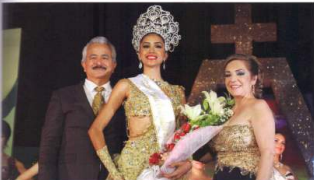
Baile de Embajadoras 2015 <<Al Son de la Belleza>>

El denominado por nuestros habitantes como <<Evento del año>>, concentró a más de 800 personas e impactó positivamente a través de los medios de comunicación como televisión, radio, prensa escrita y redes sociales.