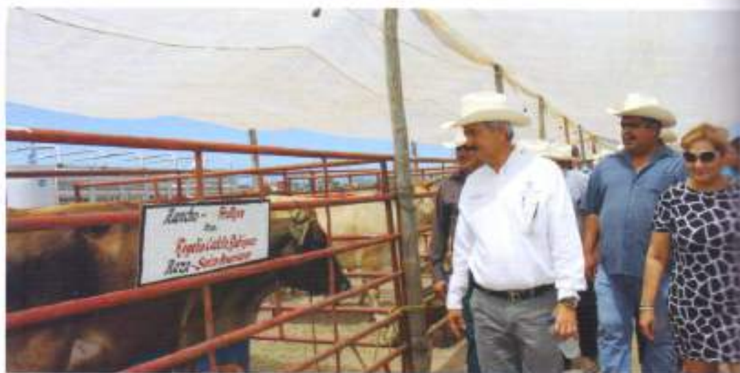
Visita al Rancho Frutilla

La ganadería es una actividad tradicional en nuestro municipio. Con la finalidad de eficientar este sector, estamos impulsando su crecimiento a través de la atención a las necesidades en la zona rural elotense.