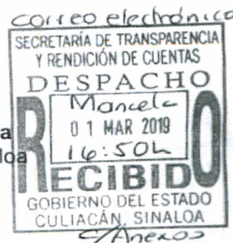
Lic. Emma Guadalupe Félix Rivera Auditora Superior del Estado de Sinaloa