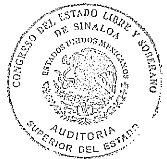
Lic. Emma Guadalupe Félix Rivera Auditora Superior del Estado de Sinaloa